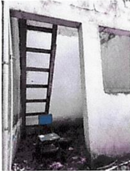
Se necesita instalar base para rotoplas