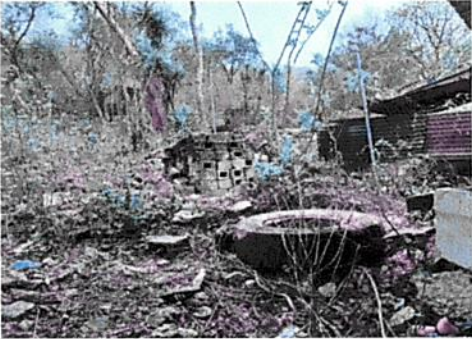
Se necesita ampliar area para cocina