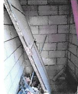
Se necesita instalar un migitorio para niños